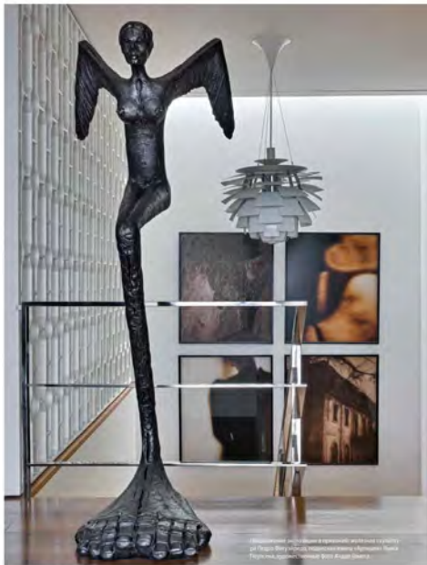
«Византизм» — скульптура в бронзе, авторство скульптора Леоно Велушиса, подлинная копия «Бронза» Пана Турская, художественный фонд Яна Феликса.